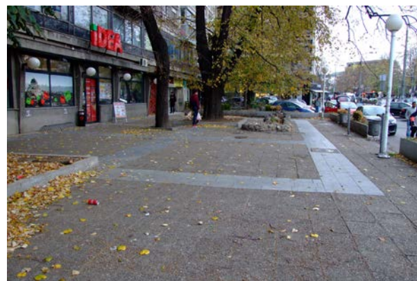
Поглед на простор будућег урбаног цепа са запада