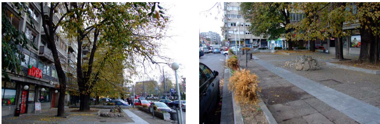
Простор будућег урбаног џепа

Обликовањем треба унапредити амбијент простора и обезбедити бољи комфор за сва чула. Обликовање треба да одговара идеји водилји и функцији, као и техничким потребама решења. Пожељно је формирати централни детаљ, односно неки специфичан репер који би био обележје/симбол простора (нпр. скулптурални елемент или водени елемент). Поред тога, треба унапредити естетику застора и обезбедити зелени "оквир" ради умањења визуелног и звучног утицаја са улице (онолико колико је то могуће).