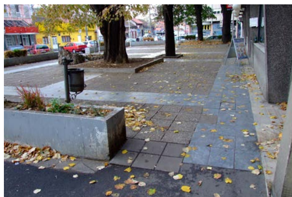
Поглед на простор будућег урбаног цепа испред зграде бр. 81